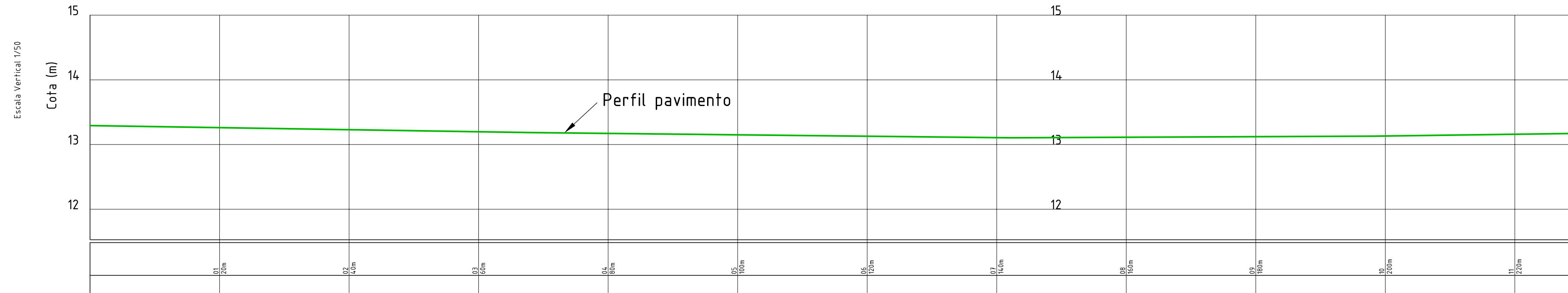
Perfil Longitudinal - Rua Joaquim Barreto